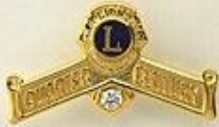
四半世紀 在籍アワードピンバッジ

サイズ 横 2.0 mm X 縦 1.2 mm 全体は金張りで、中央にホワイト 尖晶石{せんしょうせき}付き